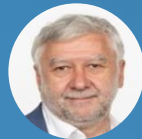
Sénateur de Loire-Atlantique Ronan DANTEC, Suppléant