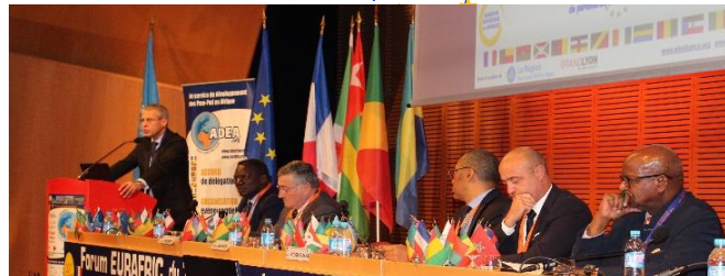
TROPHÉES EURAFRIC "PARTENAIRES DE L'AFRIQUE 2017"