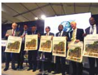
Side-event « forêt » sur le Pavillon France et dîner en présence du Ministre Stéphane Le Foll

L'ONF (Office National des Forêts), l'ONF International, la FNCOFOR (Fédération Nationale des Communes Forestières) et le Ministère de l'Agriculture, de l'Agroalimentaire et de la Forêt qui nous ont collectivement demandé d'animer un side-event sur le Pavillon France sur le sujet des forêts, d'organiser un dîner avec des Ministres en charge de la forêt dans le monde qui fera l'objet d'un journal dédié post-COP 22 et enfin d'organiser des rencontres bilatérales de haut niveau ;