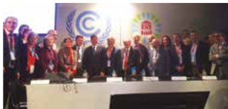
Photo de gauche : Side-event du Syctom avec le Président Hervé Marseille en présence exceptionnelle de Mustapha Bakkoury, Président de la Région Casablanca-Settat et de MASEN.

Le SYCTOM (l'Agence Métropolitaine des Déchets Ménagers) de Paris pour valoriser son savoir-faire et ses coopérations décentralisées en Afrique, organiser un side-event autour de l'acceptabilité des installations de traitement des déchets et poser les bases d'une coopération tripartite avec la Région Ile-de-France, la Région de Casablanca-Settat et le District Autonome d'Abidjan ;