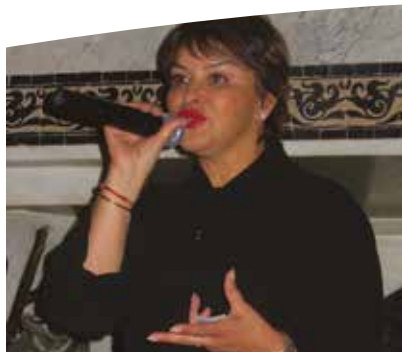
La Ministre Hakima El Haité présente à l'ensemble des dîners de Com'Publics