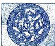
Académie de l'Eau

Académie de l'eau & Fondation Cardinal Paul Poupard- Aspects éthiques, socioculturels et spirituels de la gestion de l'eau dans le contexte du changement climatique